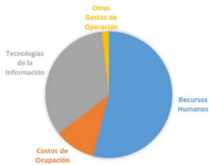
Gráfica 1. Uso de recursos durante el 2014-2015

El gasto previsto para el periodo 2014-2015 se ubica en 88.4 millones de pesos, de los cuales el mayor porcentaje habrá sido destinado al rubro de recursos humanos, seguido por la utilización de aproximadamente un tercio del gasto en tecnologías de la información y un 12% para cubrir costos de ocupación (Gráfica 1).